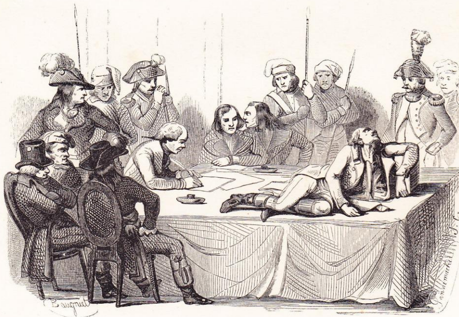
Robespierre dans l'antichambre du Comité de salut public.

entre pages 78 et 79 (éd. belge) du Musée de la Révolution française.